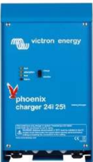
Phoenix charger 24V 25A