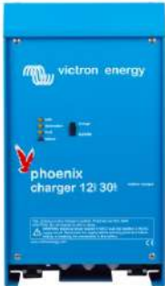
Phoenix charger 12V 30A