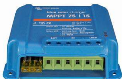
Controlador de carga solar MPPT 75/15